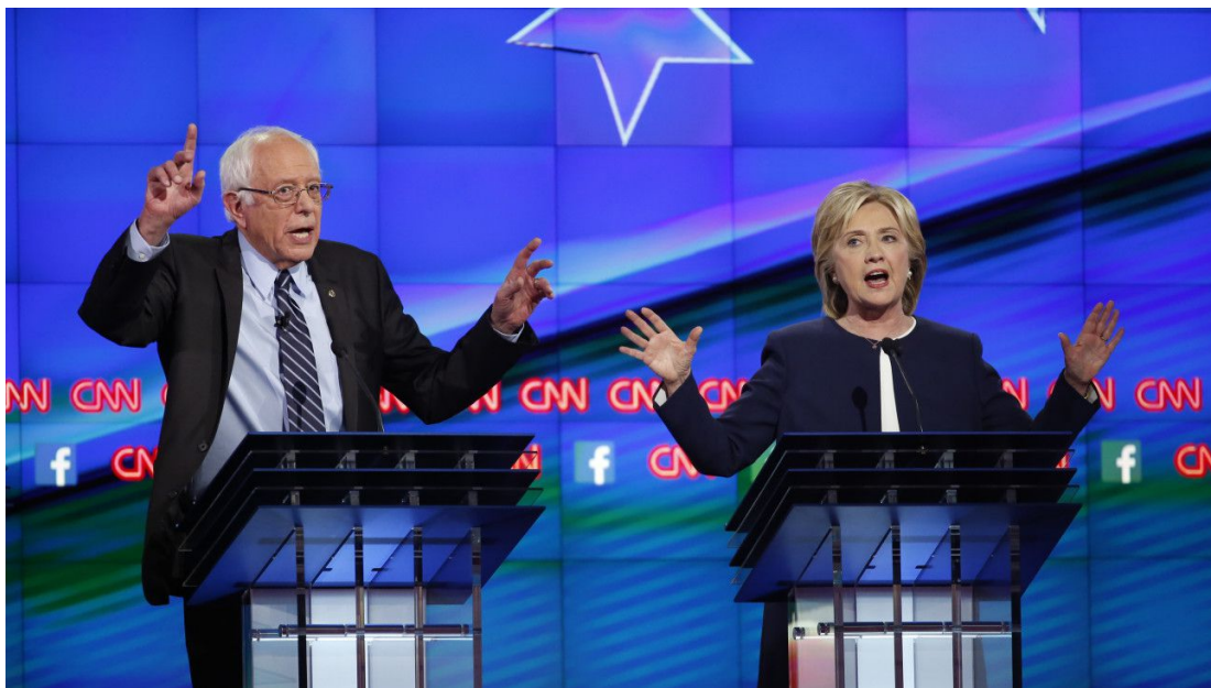
Прошу слова! Хиллари Клинтон и Берни Сандерс

С другой стороны, в 2012 году Обама тоже довольно сдержанно высказывался в отношении арабо-израильского конфликта, тем не менее примерно 2/3 избирателей-евреев проголосовали именно за Обаму.