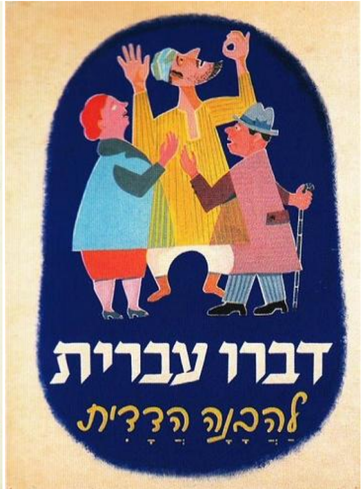
Израильские плакаты, призывающие говорить на иврите

Но объяснить можно и политику Евсекции (создание новой национальности советских евреев). И даже советский государственный антисемитизм (после Холокоста евреи больше не отвечали сталинскому определению национальности, а после образования Израиля и вовсе стали иностранной национальностью, вроде немцев, поляков или корейцев, и их надо было ассимилировать). Можно найти внутреннюю логику в любой политике в истории человечества.