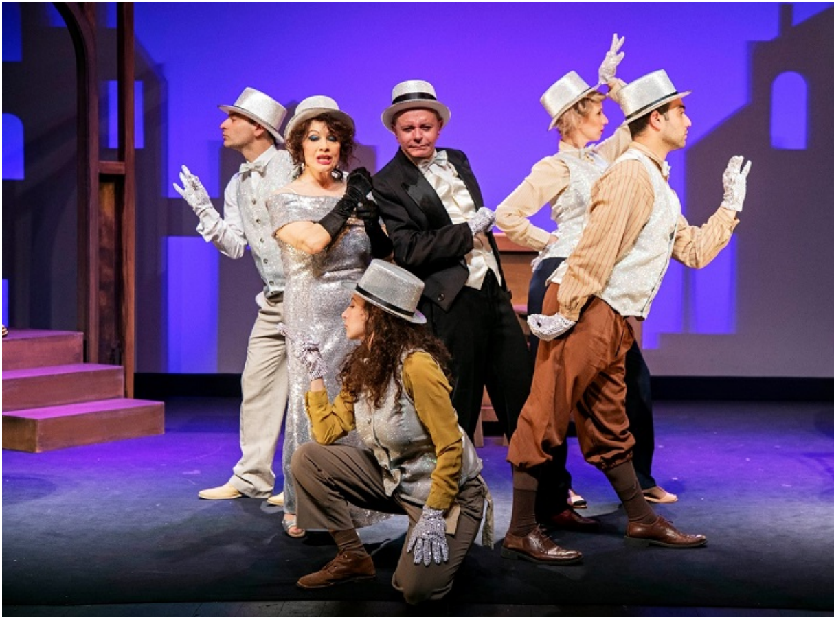
На одном из спектаклей театра «Идишпиль»

В воскресенье, 18-го июля 1948 года редактор коммунистической газеты «Коль ха-Ам» Меир Вильнер явился в военкомат по ул. Калишер в Тель-Авиве для несения воинской службы. На рутинный вопрос, какие языки он знает, Вильнер ответил: иврит, польский, немецкий и идиш. Офицер заявил, что идиш — не язык. Вильнер возмутился, но ему возразили, что издан приказ верховного командования: идиш — не язык. Ивритские газеты отнеслись к инциденту без удивления, мол, идиш — наследие галута (диаспоры), и в новом государстве ему нет места.