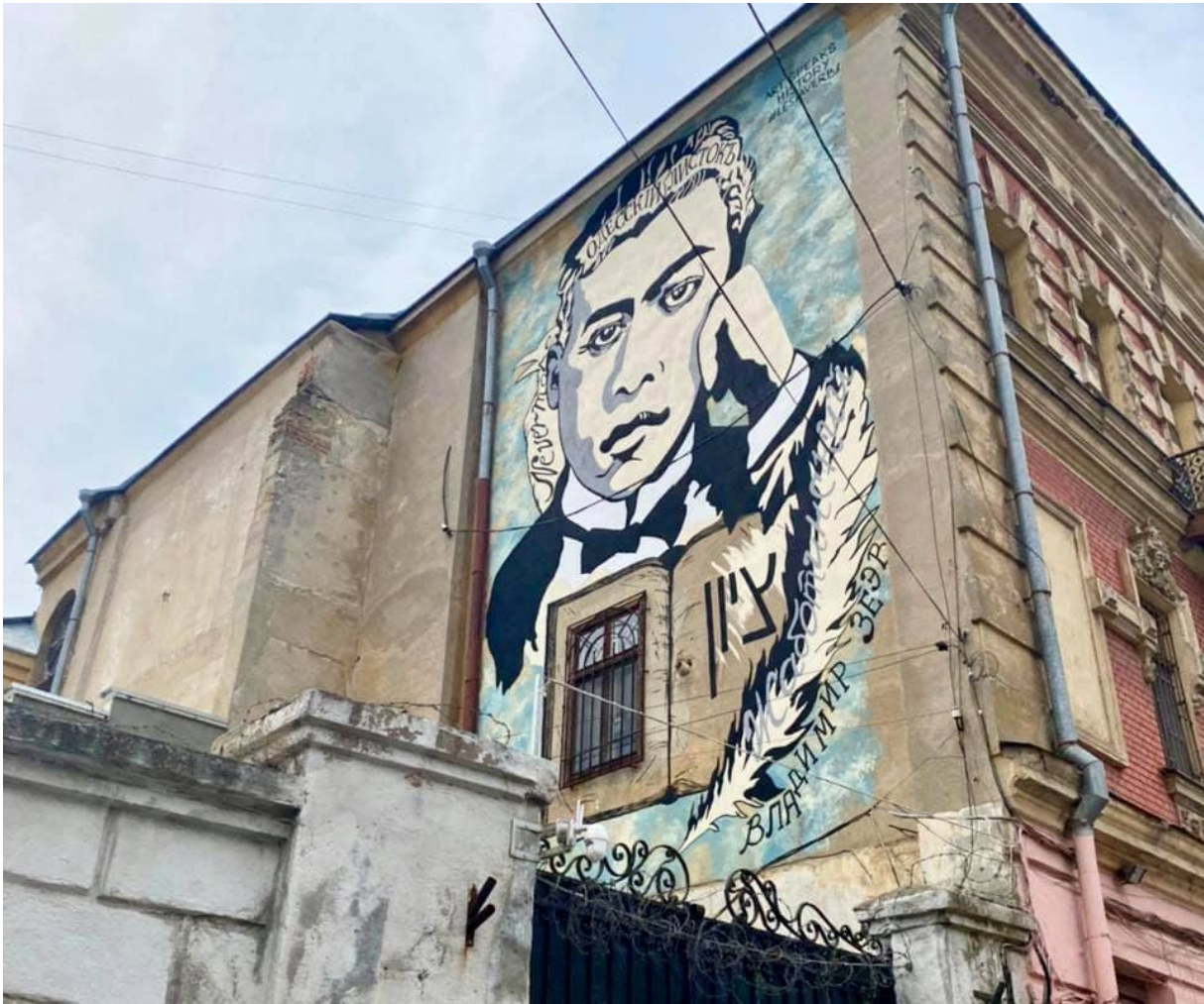
Мурал з портретом Володимира Жаботинського.

У 1880 році в будинку на Базарній, 33, народився майбутній письменник, публіцист і перекладач, ідеолог ревізіоністської течії в сіонізмі, засновник Єврейського легіону, «Іргуна» й «Бейтара» Володимир Жаботинський.