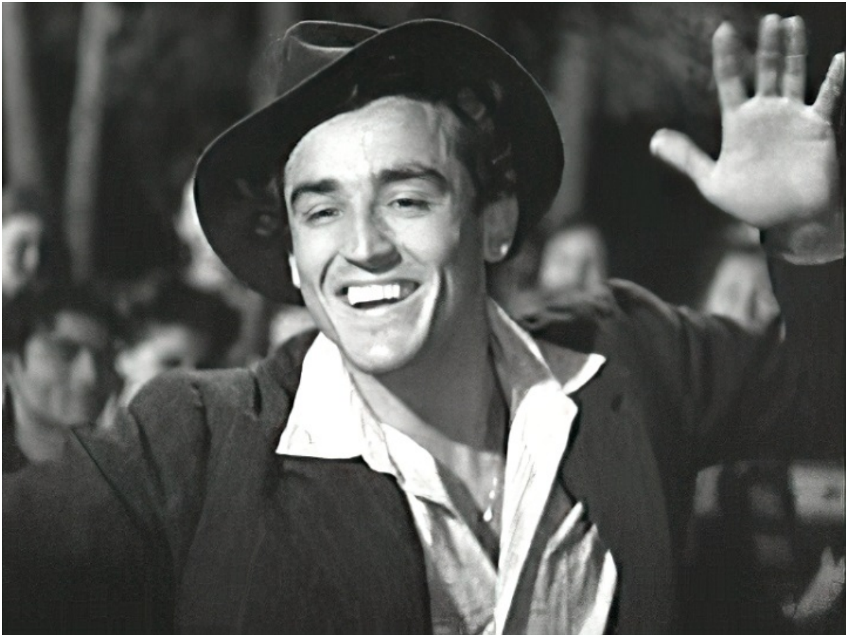
Вітторіо Гассман, 1949

В американському фільмі «Рапсодія», що йшов у радянському прокаті, його партнеркою була Елізабет Тейлор. В іншій американській картині — «Війна та мир» за романом Толстого — Вітторіо Гассман зіграв Анатолія Курагіна.