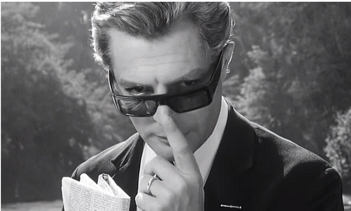
Марчелло Мастосянні у фільмі «Вісім з половиною», 1963