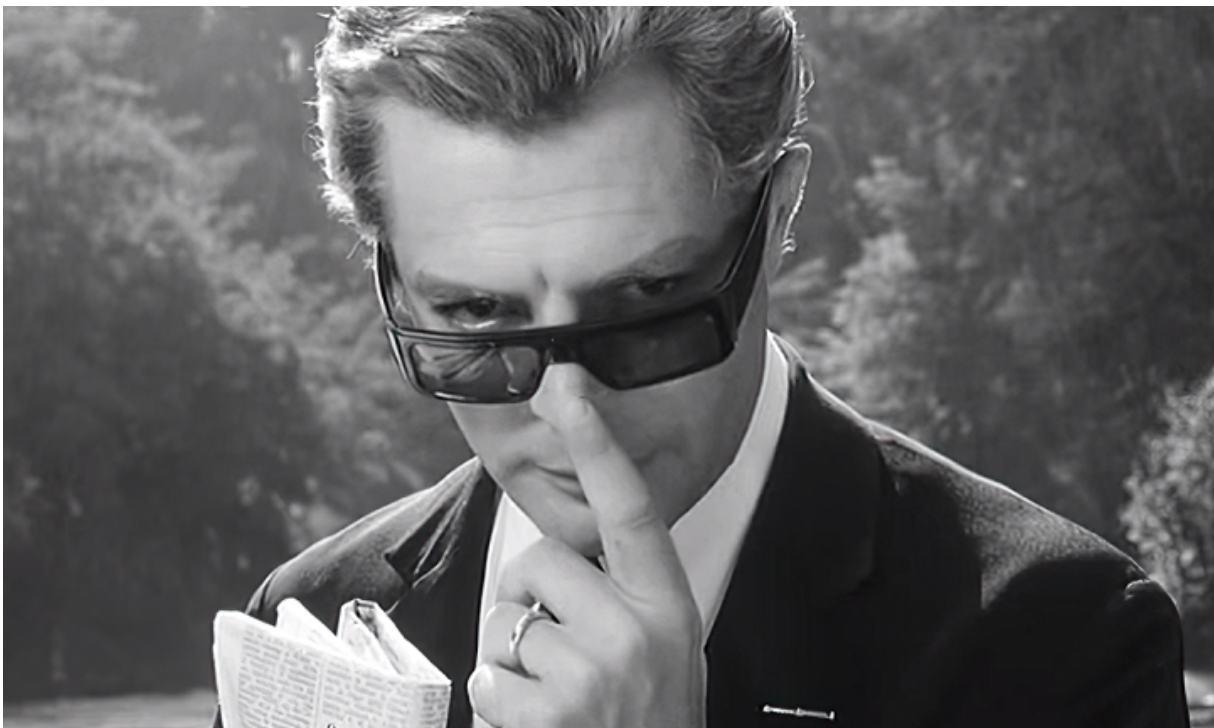
Марчелло Мастроянні у фільмі «Вісім з половиною», 1963