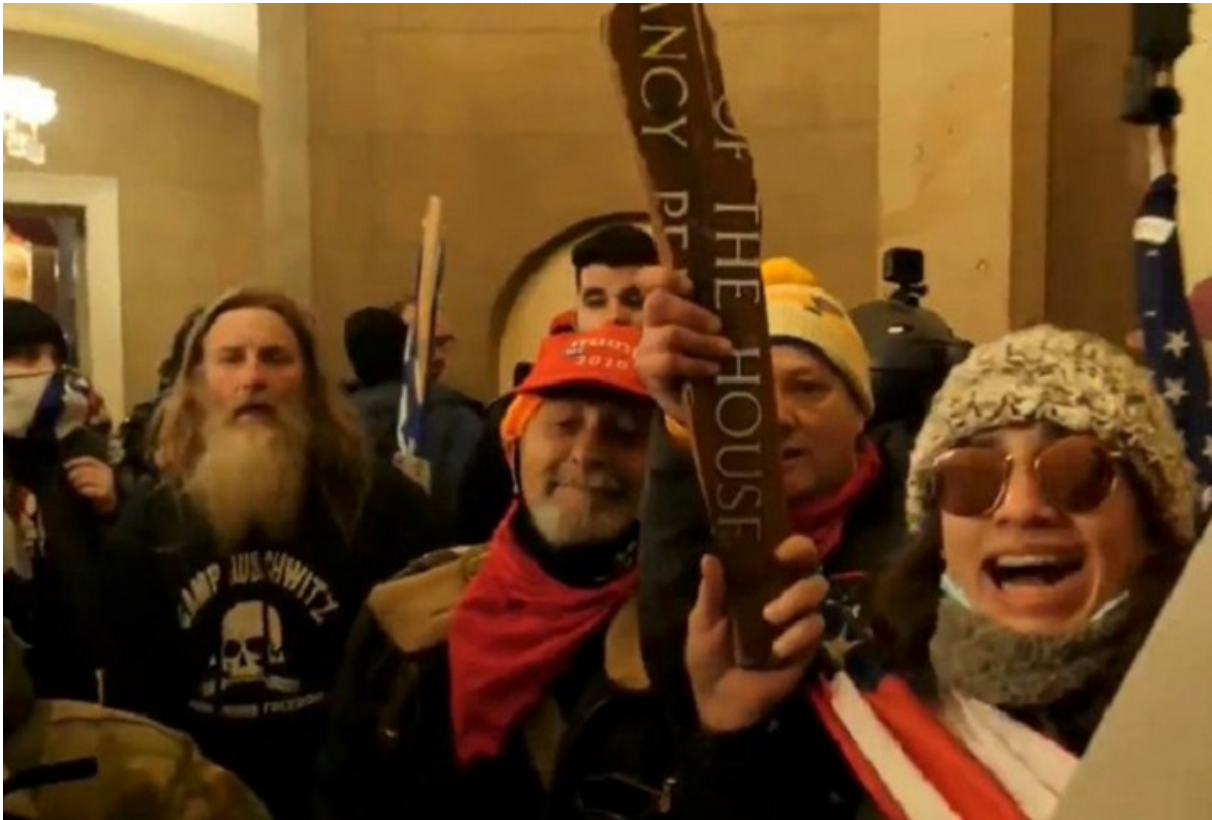
Протестующие в здании Капитолия. Слева — мужчина в футболке с надписью: Camp Auschwitz

О взглядах некоторых участников беспорядков говорят слоганы на их футболках, фото которых выложены в социальные сети. На одной из них красовалась надпись «Camp Auschwitz» поверх черепа и скрещенных костей. На другой была аббревиатура BMW (Six Million Wasn't Enough), то есть: «Шести миллионов недостаточно» (впоследствии появилась информация, что люди в футболках именно с этой надписью в тот день у Капитолия замечены не были).