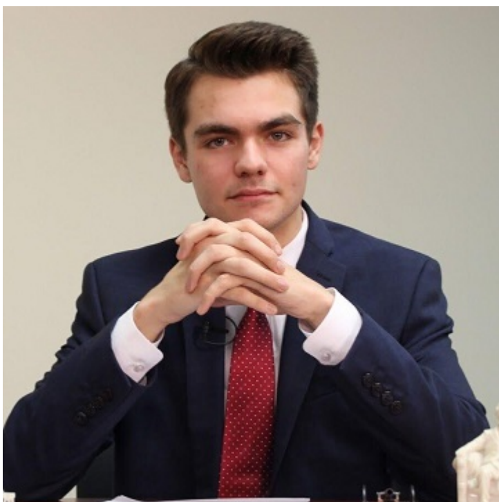
Ник Фуэнтес.