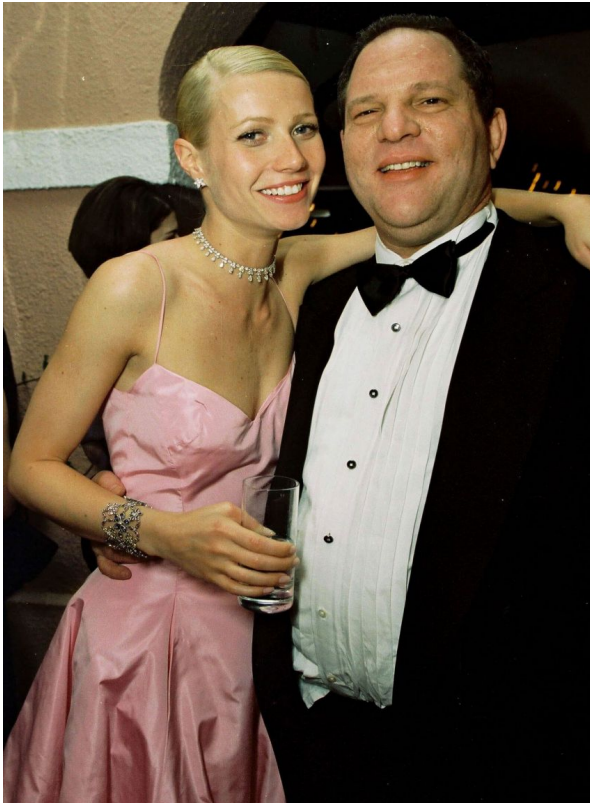
Харви Вайнштейн с Гвинет Пэлтроу